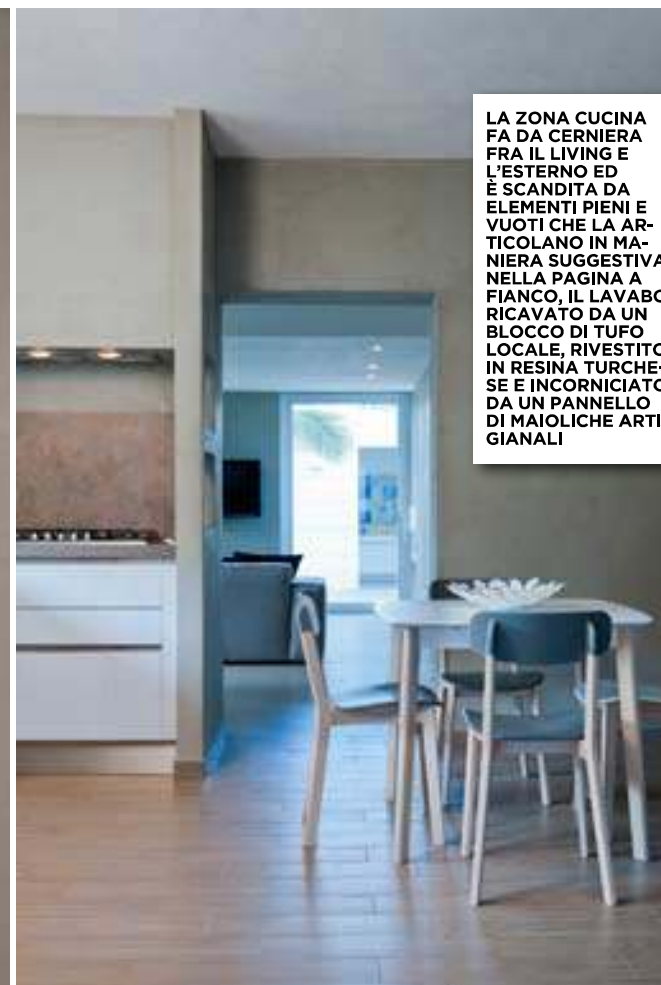
LA ZONA CUCINA FA DA CERNIERA FRA IL LIVING E L'ESTERNO ED È SCANDITA DA ELEMENTI PIENI E VUOTI CHE LA ARTICOLANO IN MANIERA SUGGERIVA. NELLA PAGINA A FIANCO, IL LAVABO RICAVATO DA UN BLOCCO DI TUFO LOCALE, RIVESTITO IN RESINA TURCHESE E INCORNICIATO DA UN PANNELLO DI MAIOLICHE ARTIGIANALI